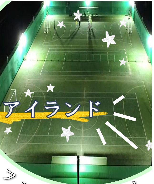
フットサルコート